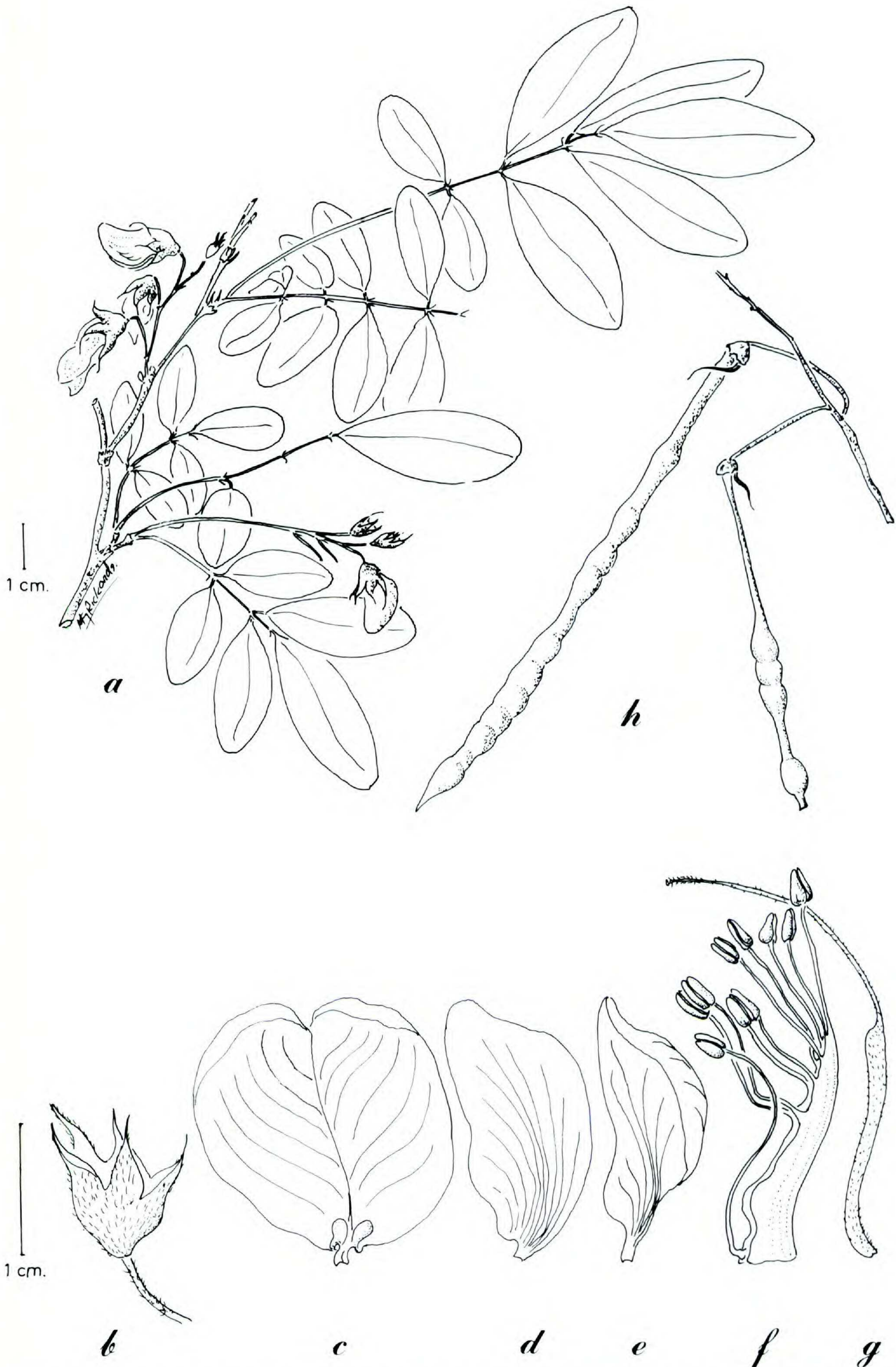
FIGURE 6. Coursetia elliptica .—a. Rama florífera.—b. Cáliz.—c. Estandarte.—d. Ala.—e. Quilla.—f. Androceo diadelfo.—g. Gineceo.—h. Infrutescencia. Las hojas y flores fueron tomadas de Stevens 9820 y los frutos de Stevens 20311 .